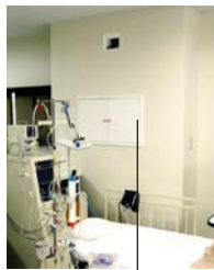
加湿器本体は壁内に